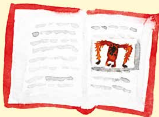
a tanulószobában az éppen olvasott könyvben,