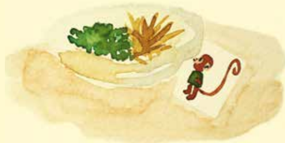
az étkezőben a tányérja alatt,