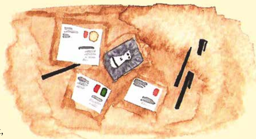
a levelei között,